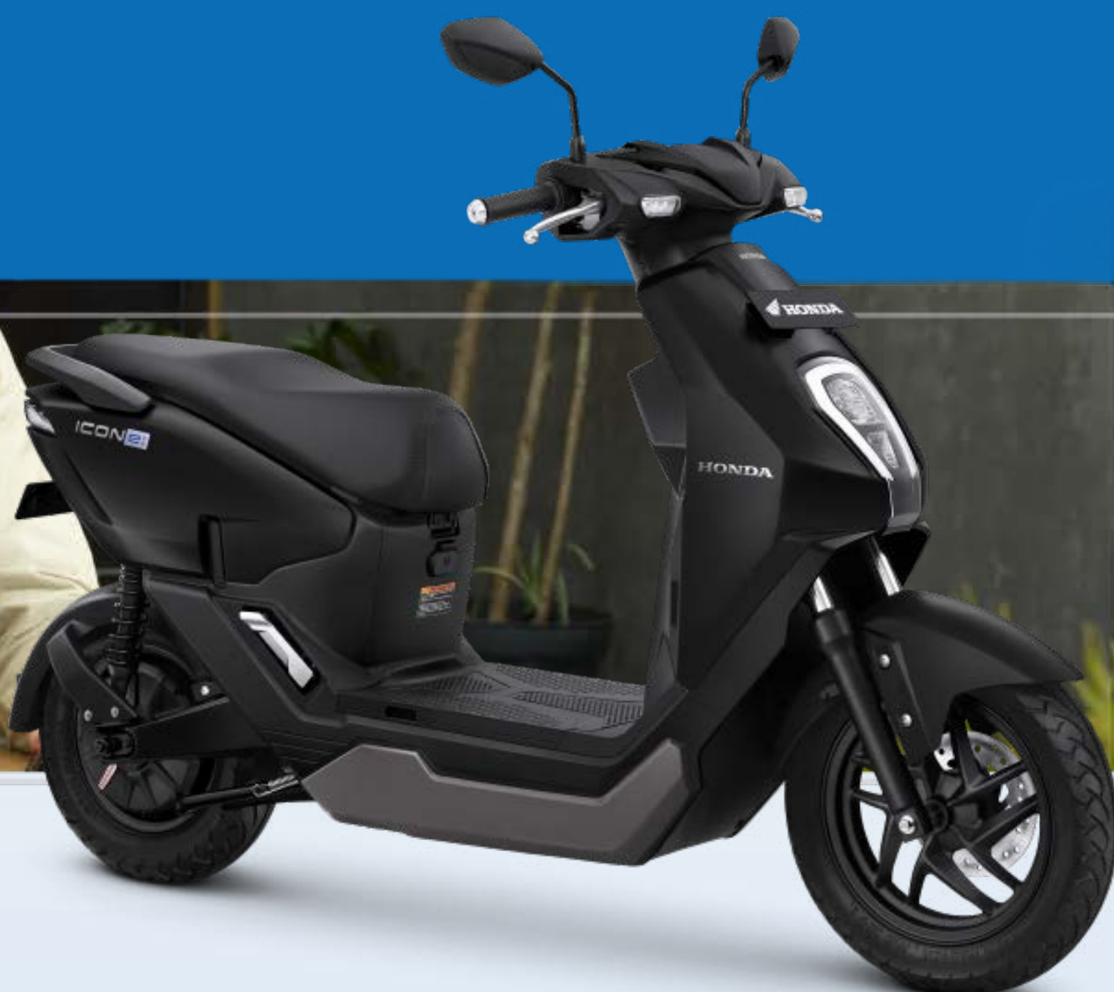
ICONIC MATTE BLACK